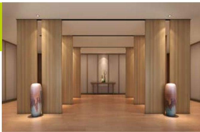
静态展示 无锡泥人厂定制六组古法酿酒工艺场景，向游客展示惠泉黄酒悠久历史