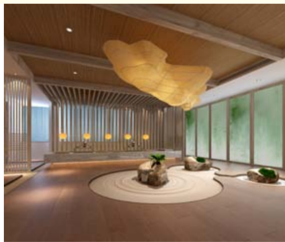
石泉水景 倒置山景吊灯象征水源地为惠山，石泉水眼说明优质水源场景，白色仿真米意味着酿酒原料为优质糯稻

惠泉酒道馆坐落于世界级禅意旅居度假目的地——灵山小镇·拈花湾，建筑面积约500m 2 。经过1年多的精心筹备和后期施工装修，由无锡业界知名设计公司首席设计师量身打造的、斥资近300万元的惠泉酒道馆终将于2016年春节前期面向中外游客开放。酒道馆以“禅意”为主题，共规划为“光之酒道”“石