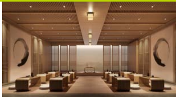
论酒道场 酒道演示、互动进一步让游客了解中华酒文化