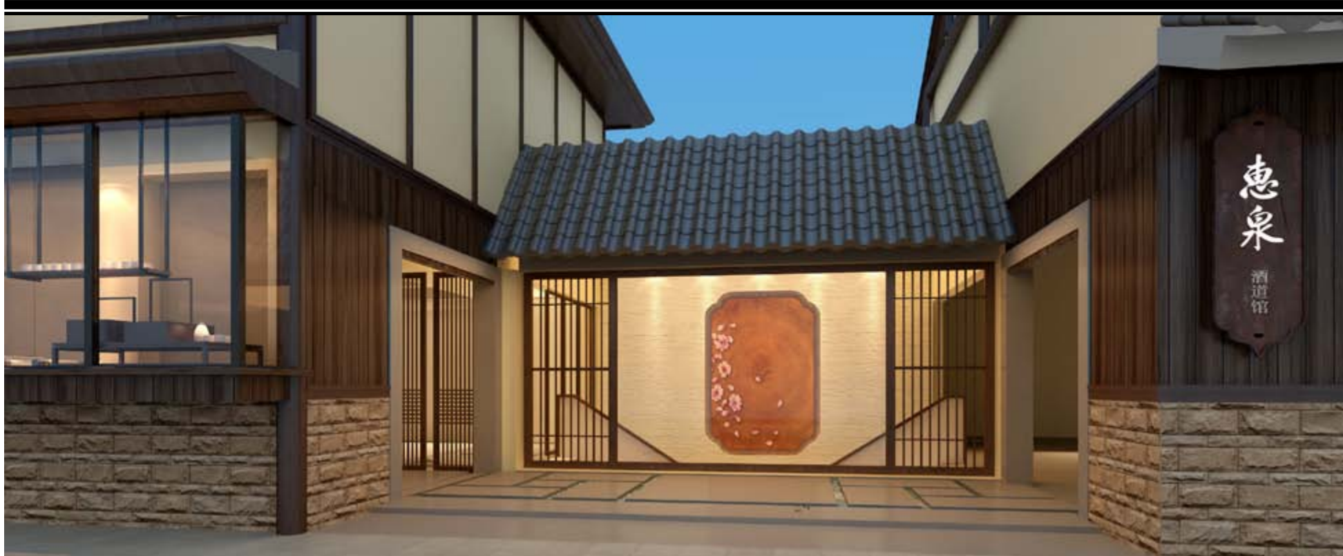
酒道馆门面 惠泉酒道馆在门面的设计上也格外用心，青石砖，琉璃瓦，古韵悠然，游客还未进门便可从这仿古的装饰中体会出黄酒文化的悠远与惠泉酒一杯一世界的格调