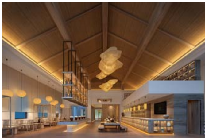
品鉴销售 设置休憩区、酒令游戏互动区、二层酒类藏书阁、吧台收银

泉水景”“论酒道场”“静态展示”“品鉴销售”五大功能区，将会为游客再现黄酒古法酿造工艺场景、演示传统酒道、开展酒令游戏以及提供酒类藏书阅读服务等，让游客可以在这里找寻黄酒的厚重与悠久，感受和学习源远流长的黄酒文化。