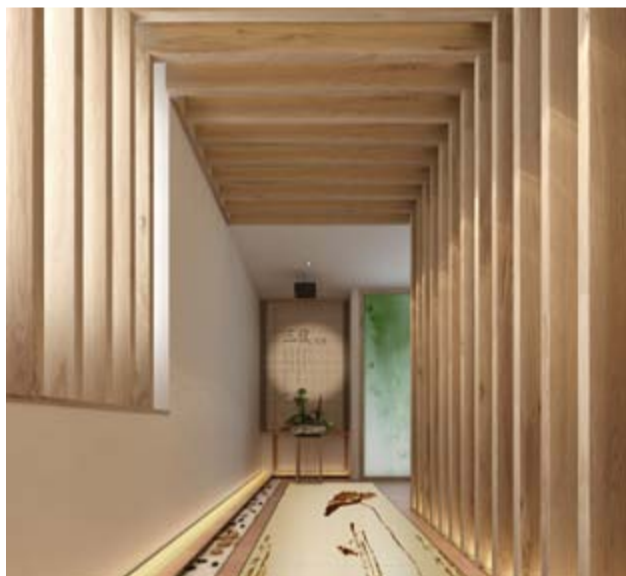
光之酒道 通过灯片投影以及仿古的装饰风格，让游客一进门就对古法酿酒工艺产生浓厚兴趣

俗语有“无酒不成礼仪”之说，自古酒便是人们表情达意的依托，也是成就各种祭典礼仪的不二之选。惠泉酒清雅而不失香醇，具有柔和之美、谦逊之态，有坚韧之格，更有仁义之品，以此成礼怕已是很多无锡人的风俗习惯了。