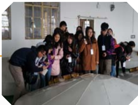
图中学生们正在参观公司后酵大罐