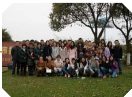
3月24日江南大学酿造专业学生到厂参观学习