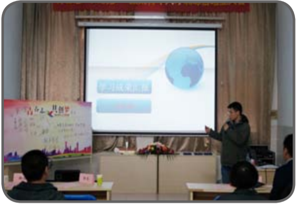
“青年人才训练营”结业大会 • 小组学习成果汇报