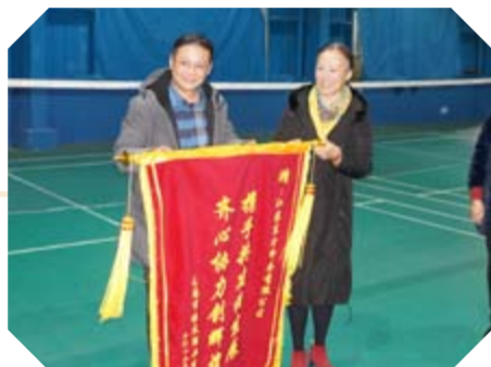
郭总代表公司向江苏东方印务赠送锦旗