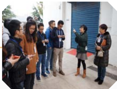
公司质保部盛科在为学生们讲解生产工艺