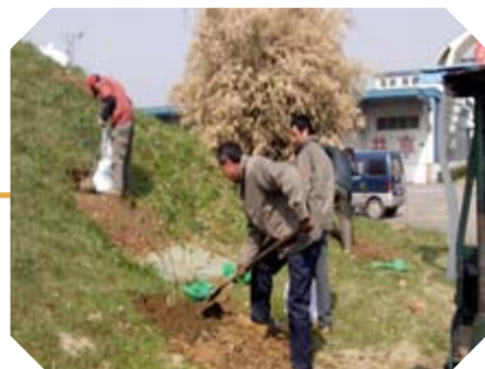
图中公司员工正在种植杨梅树