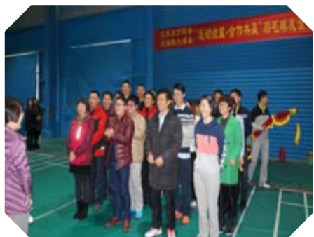
3月11日“运动结盟·合作共赢”羽毛球友谊赛