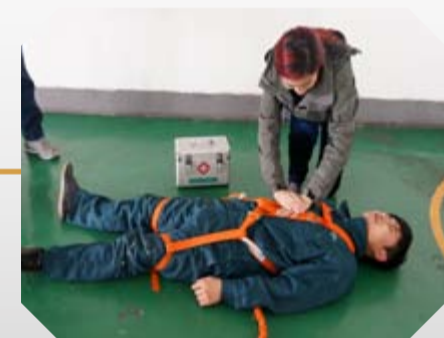
公司医护人员现场模拟对伤员得应急抢救

一年一度的无锡马拉松赛于3月20日在新体育中心如期举行，今年我有幸成为其中一员。