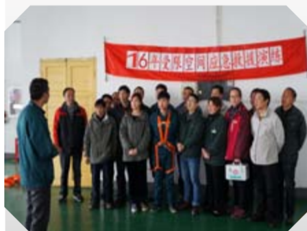
3月29日振太酒业 WZT-2016 年受限空间应急救援演练