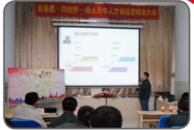
“青年人才训练营”结业大会 • 个人学习成果汇报