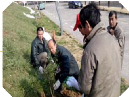
3月12日“3·12”植树节公司开展厂区绿化改造活动