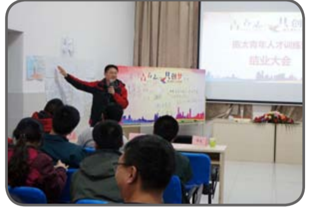
“青年人才训练营”结业大会 • 振太酒业和普朗克咨询公司的领导为学员们颁发结业证书