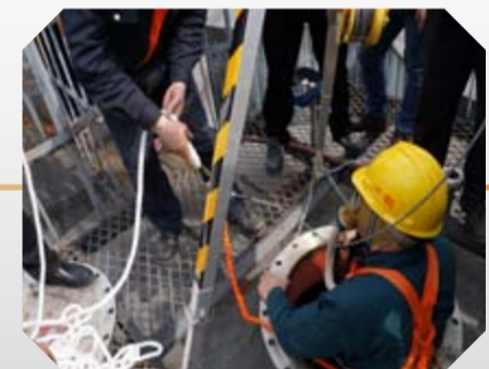
救援人员穿戴好防护服及防毒面具准备下入大罐进行救援