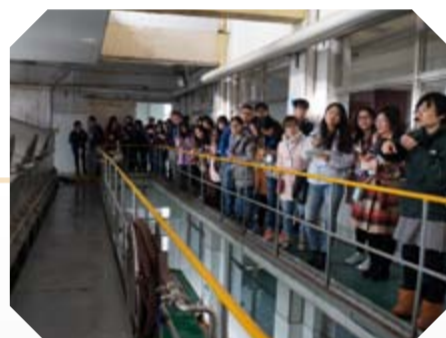
学生们参观蒸饭间