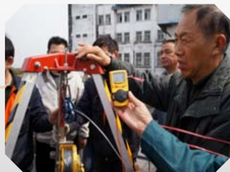
图中为演练时检测受限空间空气质量的数据